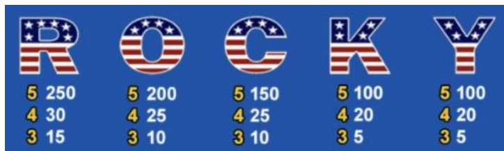
TABELLA DEI PAGAMENTI