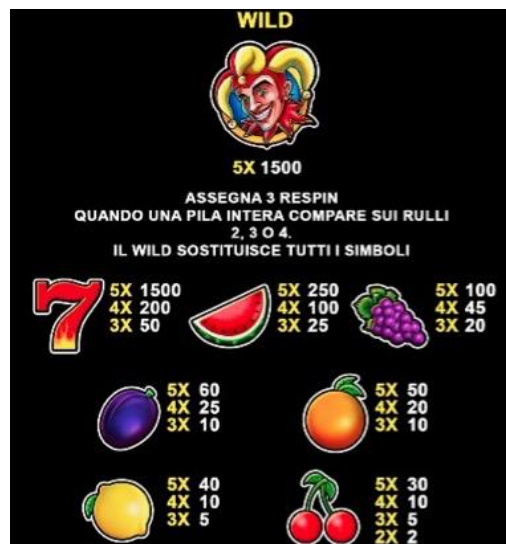
TABELLA DEI PAGAMENTI