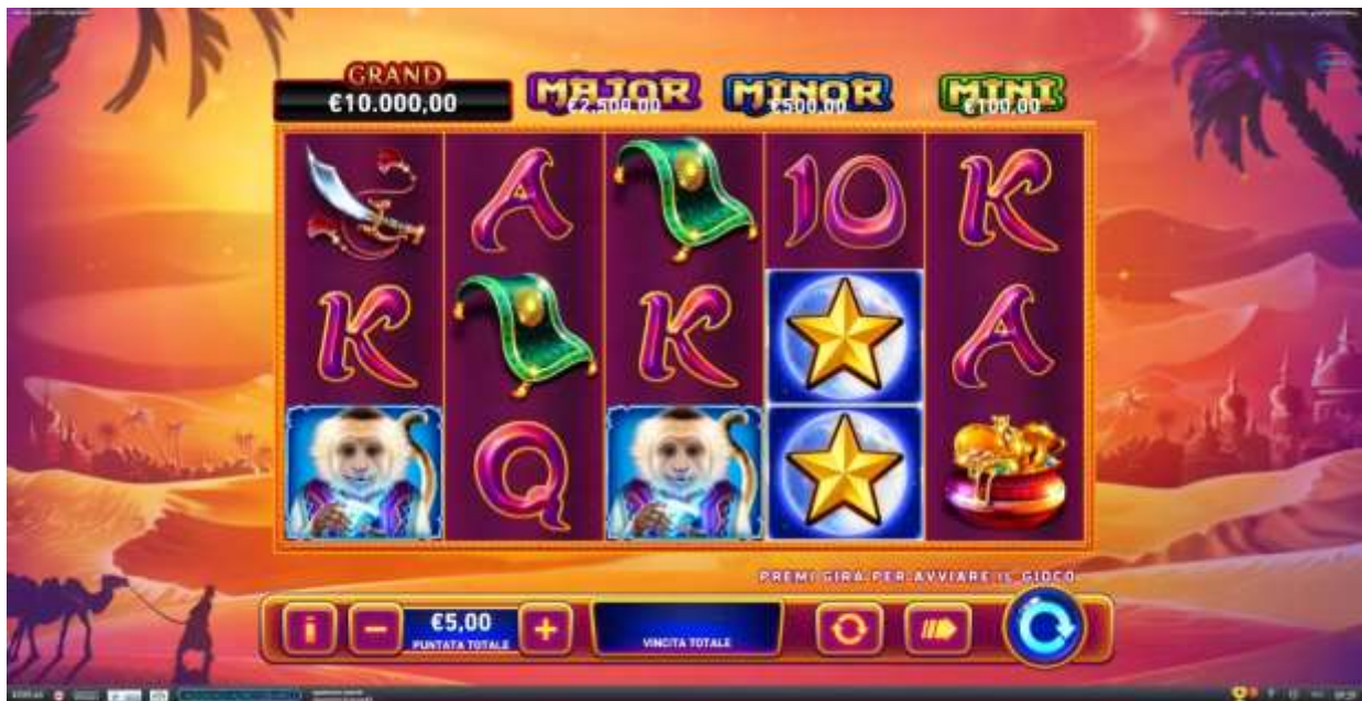
Figura 1 Schermata principale

Slot a 5 rulli e 50 linee , lo scopo di Fire Blaze: Jinns Moon è quello di ottenere combinazioni di simboli vincenti, facendo girare i rulli.