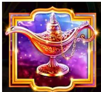
Figura 4 Simbolo Scatter Lampada

Il simbolo Scatter è la Lampada . 3 o più simboli Scatter ovunque attivano la Funzione Partite Gratis .