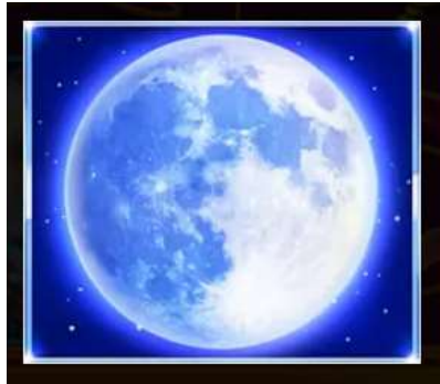
Figura 5 Simbolo Bonus Sfera Di Cristallo

La Sfera di Cristallo è il simbolo Bonus del gioco e compare su tutti i rulli