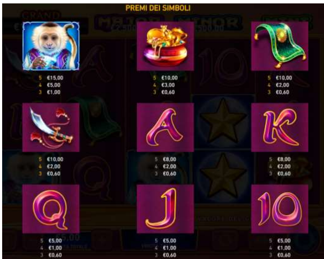
Figura 2 TABELLA DEI PAGAMENTI 1

Fai clic sull'icona X per lasciare le pagine delle Info e tornare al gioco.