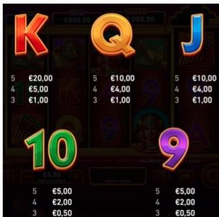
TABELLA DEI PAGAMENTI (relativa ad una puntata totale di 5 €)