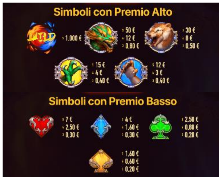
Tabella dei pagamenti

Il simbolo WILD sostituisce tutti i simboli