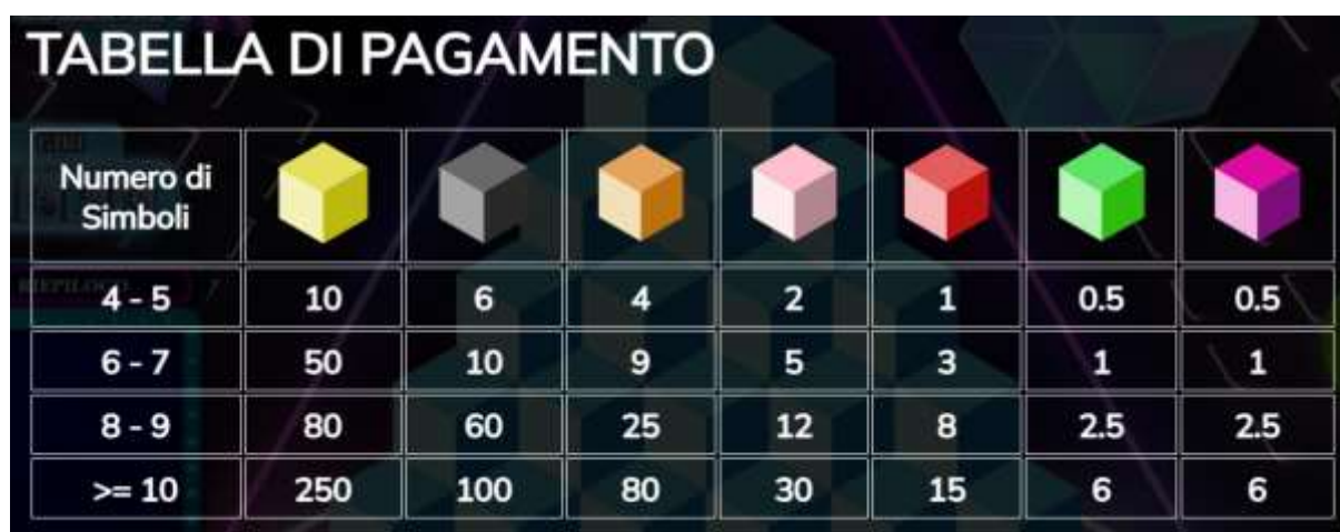
TABELLA DI PAGAMENTO DI PRIZMA

Autoplay consente al giocatore di avviare automaticamente una o più partite. Quando la modalità autoplay è attiva non puoi modificare il bet di gioco. Quando la modalità autoplay è attiva la velocità degli spin potrebbe essere più veloce.